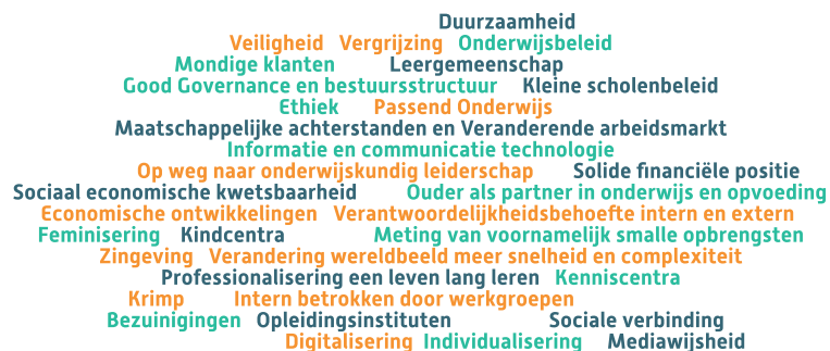
Figuur 1 Analyse interne en externe ontwikkelingen samengevat in een woordweb

Naast de punten uit dit landelijk bestuursakkoord moet Lijn 83 inspelen op de ontwikkelingen binnen de maatschappij. De interne en externe ontwikkelingen die hierbij onderkend worden, zijn weergegeven in het volgende woordweb.